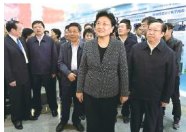
刘延东副总理在华中科技大学

2016年10月14日，中共中央政治局委员、国务院副总理刘延东莅临华中科技大学，接见第二届中国“互联网+”大学生创新创业大赛获奖学生、指导教师和专家评委代表。她强调，要按照党中央、国务院决策部署，加快实施创新驱动发展战略，深化高校创新创业教育改革，促进学生全面发展，推动产学研用结合，为促进大众创业万众创新和创新型国家建设提供有力支撑。