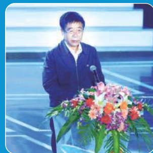
教育部部长陈宝生

第二届大赛于2016年3月启动，10月13-15日，总决赛在华中科技大学举行。学生报名项目及参与学生人数分别是首届大赛的3.3倍、2.7倍，掀起了大学生创新创业的新热潮。最终产生冠、亚、季军4名、金奖32个、银奖115个和铜奖448个。