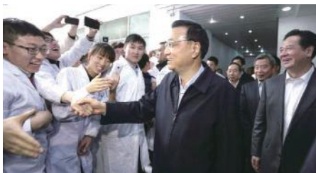
李克强总理与吉林大学师生

首届中国“互联网+”大学生创新创业大赛总决赛于2015年10月19日至20日在吉林长春举行。中共中央政治局常委、国务院总理李克强对大赛作出重要批示。批示指出：大学生是实施创新驱动发展战略和推进大众创业、万众创新的生力军，既要认真学习扎实学习、掌握更多知识，也要投身创新创业、提高实践能力。中国“互联网+”大学生创新创业大赛，紧扣国家发展战略，是促进学生全面发展的平台，也是推动产学研用结合的关键纽带。教育部门和广大教育工作者要认真贯彻国家决策部署，积极开展教学改革探索，把创新创业教育融入人才培养，切实增强学生的创业意识、创新精神和创造能力，厚植大众创业、万众创新土壤，为建设创新型国家提供源源不断的人才智力支撑。