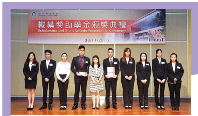
▲ 除入学奖助学金外，优秀学生亦有机会获颁机构奖助学金

成绩优秀的申请人，将有机会获颁发澳门科技大学基金会全额或半额奖 / 助学金。此外，申请人入读后如成绩优秀，还有机会获取机构奖学金。