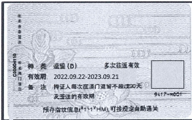
港澳通行卡(有效往來港澳簽注"逗留D")