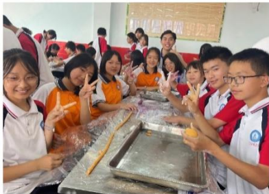
台湾美食芋圆制作