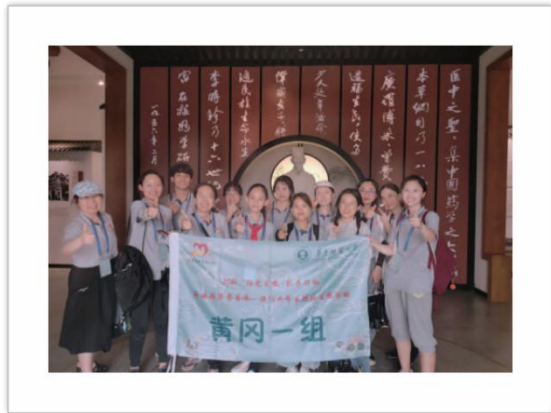
黄冈组—李时珍中医纪念馆