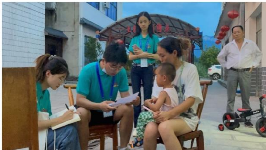
乡村实地入户调研