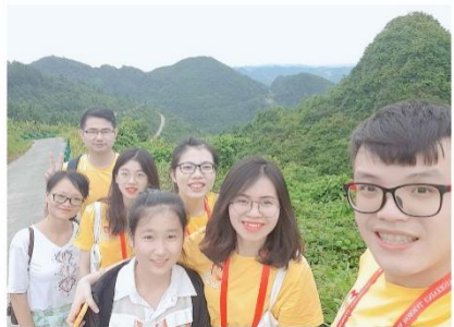
跟大山的孩子一起走回家路