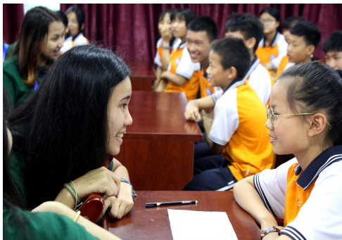
用心交流：我的眼里都是你