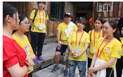
听乡亲讲“我们村的这些年”