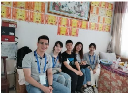
探访“别人家的孩子”