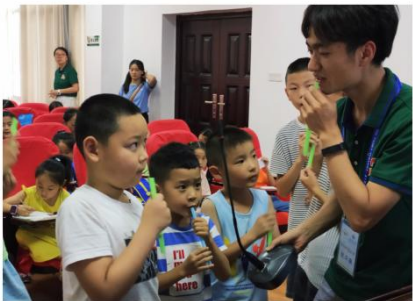
自制乐器-吸管排箫