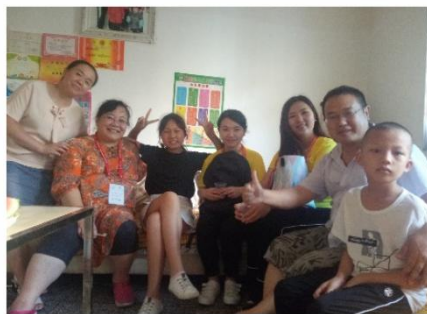
“欢喜与忧愁”之老师来了