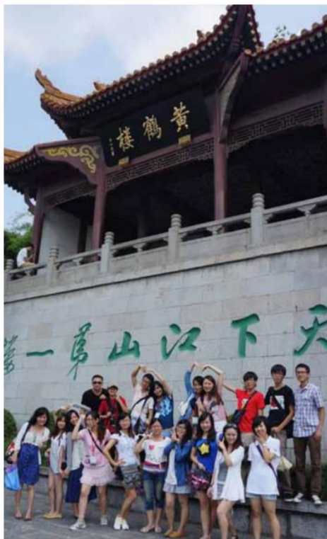
天下江山第一楼：黄鹤楼