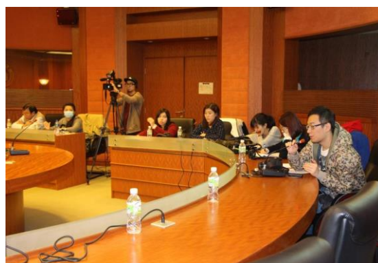
『澳門消費者信心指數 2014 年第 4 季』新聞發佈會現場