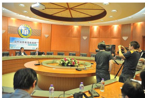
『澳門消費者信心指數 2015 年第 1 季』新聞發佈會現場