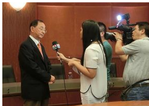
『澳門消費者信心指數 2015 年第 2 季』新聞發佈會現場