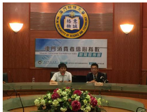
『澳門消費者信心指數 2015 年第 3 季』新聞發佈會現場