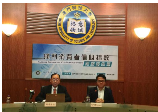
『澳門消費者信心指數 2016 年第 2 季』新聞發佈會現場