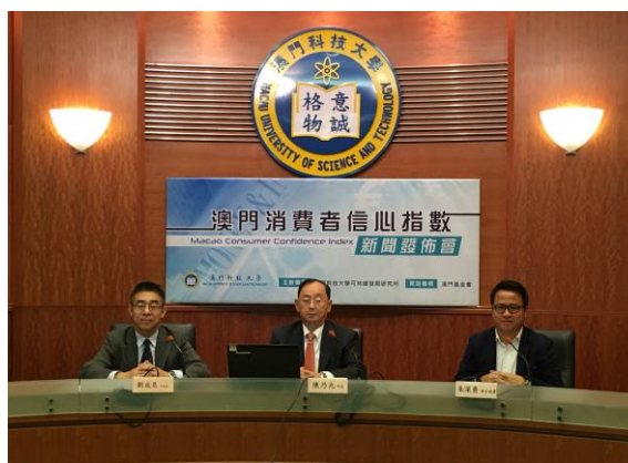
『澳門消費者信心指數 2016 年第 3 季』新聞發佈會現場