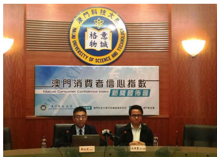
『澳門消費者信心指數 2016 年第 4 季』新聞發佈會現場

澳門科技大學可持續發展研究所於 2016 年 12 月 13 日至 19 日利用電話訪問系統 (CATI)，按電腦隨機抽樣，成功訪問了 1,002 名 18 歲或以上的澳門居民。受訪者以 1 至 200 分評分， 小於 100 表示“信心不足”、大於 100 表示“有信心” 。指數問卷調查評分標準根據被訪者對各問卷問題的評價而定。