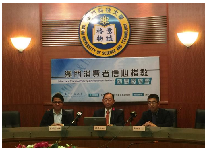
『澳門消費者信心指數 2017 年第 1 季』新聞發佈會現場

澳門科技大學可持續發展研究所於 2017 年 3 月 22 日至 29 日利用電話訪問系統 (CATI)，按電腦隨機抽樣，成功訪問了 1,009 名 18 歲或以上的澳門居民。受訪者以 1 至 200 分評分， 小於 100 表示“信心不足”、大於 100 表示“有信心” 。指數問卷調查評分標準根據被訪者對各問卷問題的評價而定。